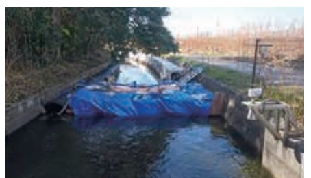
豊橋市森岡町地内