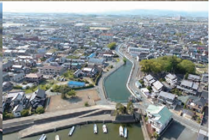
牟呂用水最終樋門(牟呂用水終点)