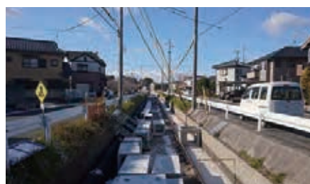
豊橋市牟呂外神町地内