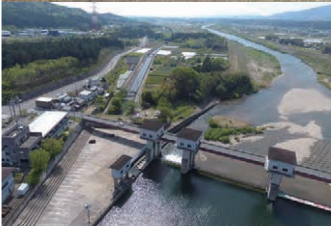
牟呂松原頭首工(牟呂用水起点)