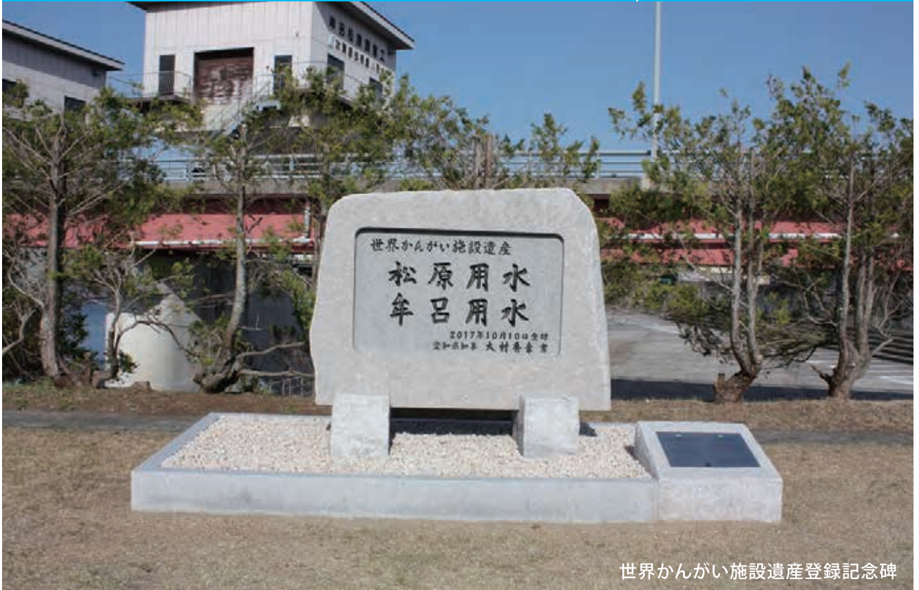
世界かんがい施設遺産登録記念碑