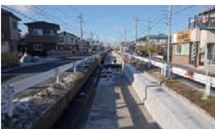
豊橋市花田町字小松地内